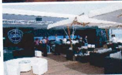
La sdraio luminosa a due piazze. A fianco lo spazio Lancia Café.