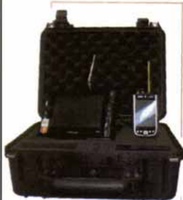
Tester di rete Ivive Technologies

La Audio Network Technology , con sede vicino a Milano, ha presentato le sue numerose soluzioni di trattamento dell'audio rientranti del logo Ant (microfoni, amplificatori, equalizzatori) destinate a teatri, audito-