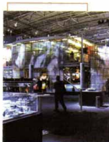
Pannelli luminosi G-LEC

Ancora soluzioni di illuminazione dalla G-Lec (nulla a che vedere con l'acronimo precedente) che di fatti produce pannelli trasparenti a Led adatti a svariate applica-