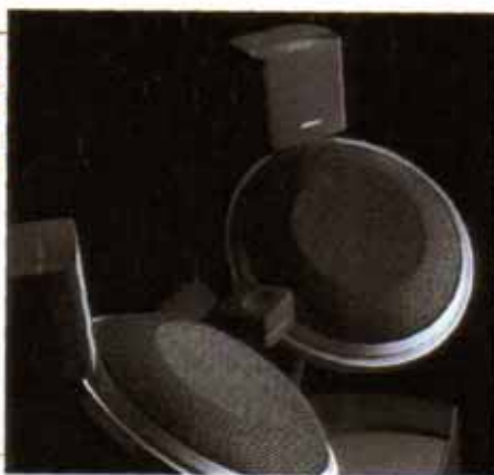
Sistema audio professionale Auditioner II di Bose

Quello di Bose , per chi ha un minimo di dimestichezza con l'audio, è un nome che non ha certo bisogno di presentazioni, con disponibilità in Italia di una filiale diretta con sede a Roma. Al Sib Forum ha puntato sulle soluzioni commerciali per luoghi pubblici curati dalla propria Divisione Professionale che, tramite l'apposita organizzazione interna, segue e realizza tutte le fasi di un impianto di diffusione: progettazione, gestione del sistema, scelta di prodotti e accessori, installazione, servizi post-vendita. Di particolare interesse, nell'offerta Bose, la disponibilità del sistema Modeler e Auditorioner III che, prima ancora della posa in opera, consente ai progettisti di ascoltare e valutare le prestazioni dell'intero impianto.